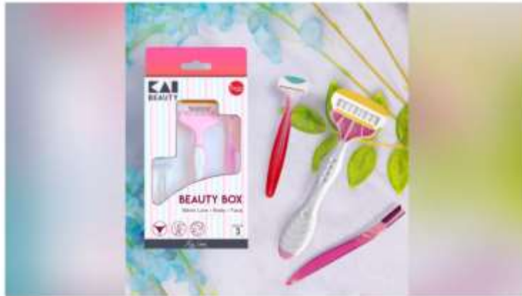
This Valentine's, Gift Your Loved One a KAI Beauty Box