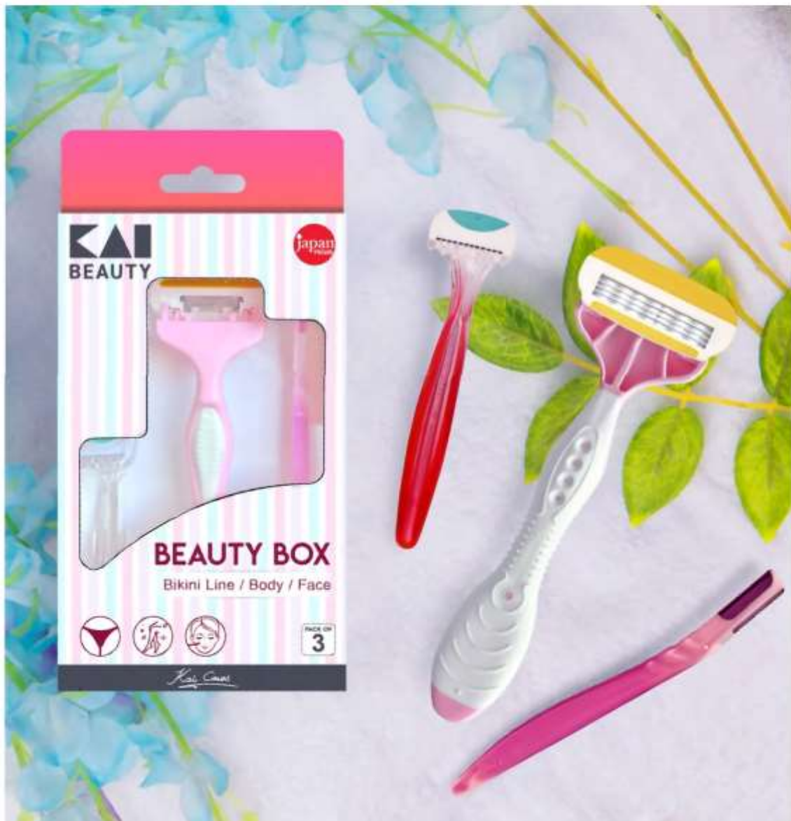
Kai Beauty Box

The Kai Beauty Box set is a do-it-quick fix – seriously. It does a clean and efficient job of giving your skin a smooth and bump-free texture. This renowned Japanese brand is also magic on sensitive skin.